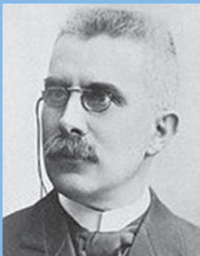
Henry Louis Le Châtelier (1850-1936)

Henry Louis Le Châtelier est un chimiste français, connu entre autres pour ses travaux sur :